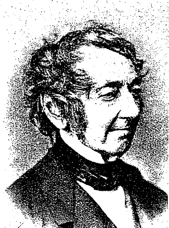
Carsten Hauch. 1790—1872.