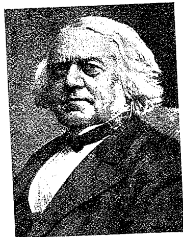
D. G. Monrad. 1811—87.

Ikke heller fra grundtvigsk Side savnedes Angreb mod de fremmede Tanker, der nu med Brandesianismen dukkede op paa dansk Kulturgrund. En vis Modsætning vedblev gennem Tiderne at bestaa mellem den folkelige og kristelige Grundtvigianisme og den hedenske og kosmopolitiske Brandesianisme. Det skulde bare mangle andet! Og dog behøver det udtrykkeligt at bemærkes. Thi under den politiske Kamp i Provisorieaarene sluttedes der i givne Perioder en faktisk Alliance mellem det „danske“ Venstre og det „europæiske“ Venstre. En saadan Konstellation var selvfølgelig i Aand og Væsen bundunaturlig, og endnu den Dag i Dag maa det undre, at ikke den kærnesunde danske Bondestand reagerede med al behørig Voldsomhed. Dette skete imidlertid ikke til Trods for, at man dog drev Udfordringen vidt ud. Sin allersælsomste Blomst satte Forbundet vel nok, da de gode