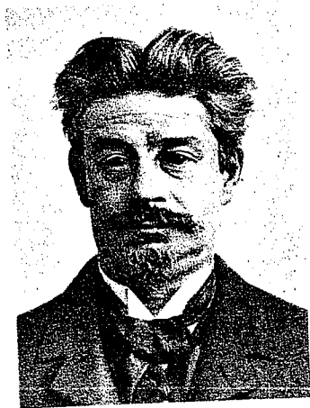
Georg Brandes. 1842—1927.

rialistisk betonet Radikalisme, der paa en hedensk Livsopfattelses Grund har virket for et Brud med Folkets nationale og kulturelle Arv til Fordel for en teoretisk og snævert rationalistisk Samfundsindstilling, negativt opløsende af Væsen, forlorent kosmopolitisk af Aand. En Skov af vajende Vimpler med politiske Programdeviser har kendetegnet denne Bevægelses Fremmarch. Med hensynsløs Opportunisme har den sejrrikt fremtrængende Socialisme udnyttet det Røre, den rejste, og suget Fordel af det Opbrud, der fulgte i dens Køl vand.