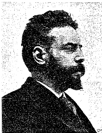
Henrik Pontoppidan, f. 1857.