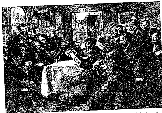
Erik Henningsen: „Et Møde i Foreningen „Bogstaveligheden", medens I. P. Jacobsen læser op.

Siden skulde Jubelen forstumme. Hos mange af hin Tids unge forvandlede kun altfor hastigt den sydende Begejstring til Tomhed og Tyngde. Den første Fryd slog om i Fortvivlelse og Livslede. Herom er Vidnesbyrdene mange, ogsaa i Litte-