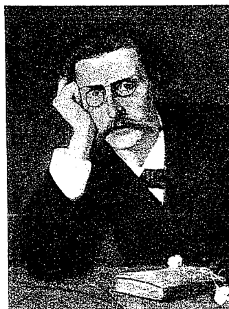
I. P. Jacobsen. 1847—85. Maleri af E. Josephson paa Frederiksborg.

Digteren Johannes Jørgensen , der i sin Ungdom tilhørte den brandesianske Bevægelse (for siden at havne i den katholske Kirkes Moderfavn), skildrer i sin Selvbiografi „Mit Livs Legende“, hvorledes de nye Tanker virkede hos den Ungdom, der blev grebet af dem. Man blev „Fritænker“ i dette Ords konsekvente Betydning; „fri“ blev man baade i Tanke og i Liv. I Teori benægtede man vel Modstandernes Paastand, at Fritænkeri nødvendigvis maatte føre til „Frileveri“, til „Usædelighed“ i dette Ords almindeligt opfattede Betydning, og henviste til I. P. Jacobsen „som den, der i Praksis havde ført Modbeviset og