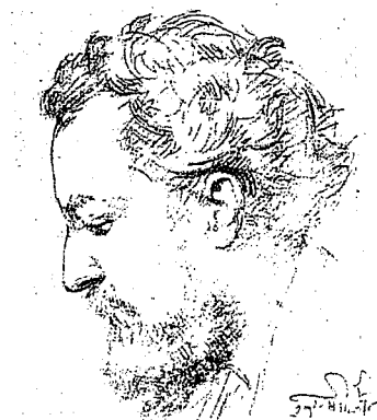
Holger Drachmann. 1846—1908. Tegning af P. S. Krøyer fra 1871.

paa den rene Atheismes Grund levet et efter kristelig Moral uangribeligt Liv". „Men", tilføjer han, „naar dette principielt var slaaet fast, saa kan det ikke nægtes, at vi tog vort Mon igen og erklærede: „Men iøvrigt — hvorfor er egentlig den saakaldte Usædelighed usædelig?"