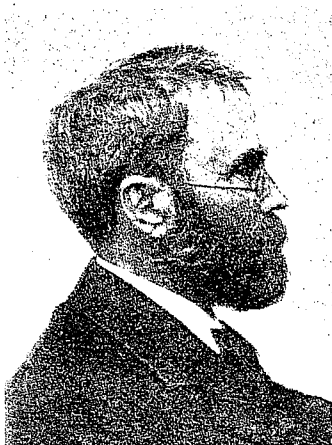
Alfred Ipsen. 1852—1922.