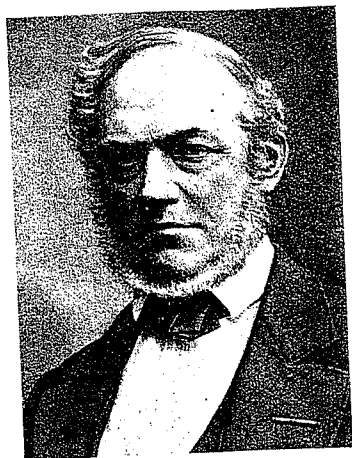
Carl Ploug. 1813—94.

somt savnede Ploug tilstrækkelig Indfølgelse til med fornøden Effektivitet at føre Striden over i Fjendens Lejr. I den polemiske Fægtning med Hopliten blandt Nationalliberalismens gamle Penneførere dækkede Brandes sig ved Parader af utaalelig Arrogance. Nuancering var ikke Plougs Sag; men paa centrale Punkter lykkedes det ham dog at gaa igennem Paraderne med hvasse Sværdhug. Han saa klart, hvad Bevægelsen inderst inde bar i sit Skjold og afdækkede virkningsfuldt dens Atheisme, dens hedenske Etik, dens forfærdende Mangel paa Pietet, ligesom han intuitivt saa, at dens Ideologi kunde blive en frodig Grobund for en fremtidig socialistisk Bevægelse, en Paastand, der trods Brandes' Benægtelse dog faktisk har vist sig at have sin Gyldighed. — Ogsaa Monrad tog til Orde i kloge og vægtige Indlæg, hvis skarpsindige Indtrængen i Problemerne i visse Stykker tvang Brandes over i Defensiven.