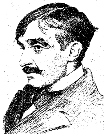
Herman Bang. 1857—1912.

Vilhelm Becks aandsfriske og myndige Førerskab Den indre Mission voksende Tilslutning i vide Kredse af Folket. Og med den gamle nationale Kultur var der fremdeles givet en aandelig Kapital, der kunde staa for lange Tidens Udmarvningsforsøg. De Befolkningselementer, der sugede deres aandelige Næring af disse Kilder, holdt sig fri af den Depression, der mere og mere gav sig til Kende, hvor Naturalismens Fortalere søgte at skildre „Virkeligheden“. Symbolsk for i alt Fald en Gren af Bevægelsen var Betegnelsen „Haabløse Slægter“, tillige Titlen paa en af Herman Bangs Bøger. Og Johannes Jørgensen, hvis Skildring af Bevægelsens Præg i Firserne foran er