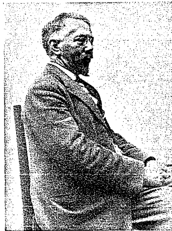
Johannes Jørgensen, f. 1866.

Men hvorledes reagerede den gamle Aandskulturs Repræsentanter mod den nye Bevægelse? Fandt man sig stiltiende i at afgive Føringeren til den himmelstormende, magtsyge Usurpator? Ingenlunde. Fra første Færd stillede man sig en garde over for den nye Forkyndelse, hvis Farlighed man i alt Fald i vid Udstrækning var sig bevidst. I „Fædrelandet“ tog saaledes Carl Ploug til Gemæle med hele den massive Kraft, der polemisk var hans Styrke. Det var Slagsværd mod Kaarde, Djærvhed og Tyngde mod Smidighed og Elegance. Utvivl-