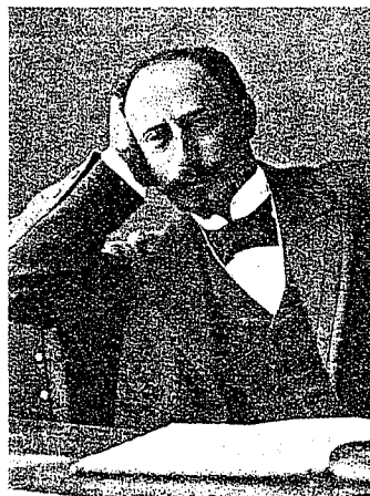
Edvard Brandes. 1847—1931.

I denne Verskrig forsvarer Kaalund de kon-