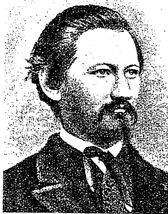
Sophus Schandorph. 1837—1901.

Om selve det reelle i Sagen kunde det dog maaske være paa sin Plads at anføre, hvad Vilhelm Andersen, der vel kan siges at have Forudsætninger for en nøgtern og upartisk Dom i dette Stykke, skriver herom i „Det danske Folks Historie“. Han siger: „Brandes' Værk er som al hans Gerning ikke Videnskab som Tyskeren H. Hettners „Det attende Aarhundredes Litteraturhisto-